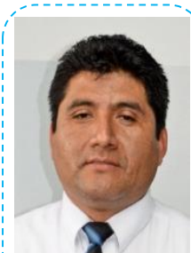
Wilder Sotomayor Electricidad Motos