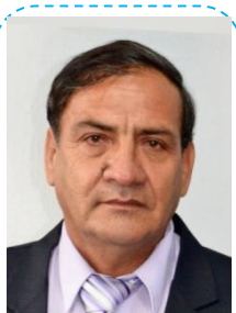
Filadelfio Coronel Mecanica Motos