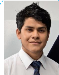
Carlos Bueno Microsoft Excel