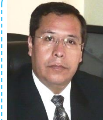
Wilmer Sumalave Microfinanzas